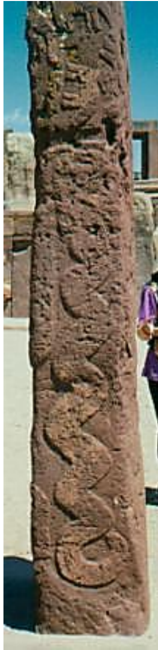
Monolito que muestra el ascenso de la Divina Madre

Y aquí se halla la clave del trabajo: la SERPIENTE