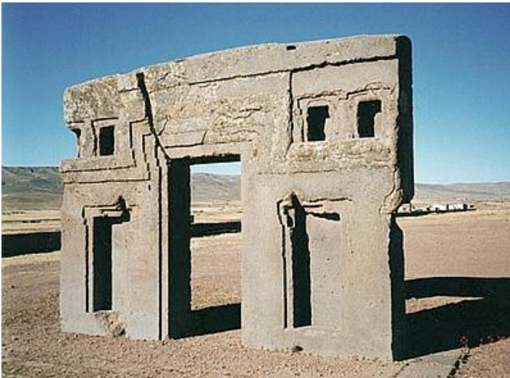
Parte posterior de la Puerta del Sol

A través de esas 4 "ventanitas" y especialmente de las dos "bóvedas", se podía INGRESAR o SALIR a las DIMENSIONES SUPERIORES DEL ESPACIO .