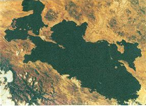
Lago Titicaca, vista satelital