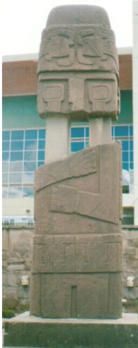
Monolito trasladado de Tihuanacu a Miraflores, ciudad de La Paz -Bolivia

Los Maestros vivientes del Tiahuanaco, vivieron la Muerte Mística en base a las prácticas del Arcano Solar, efectuadas en los grandes Templos Iniciáticos de la LOGIA BLANCA.