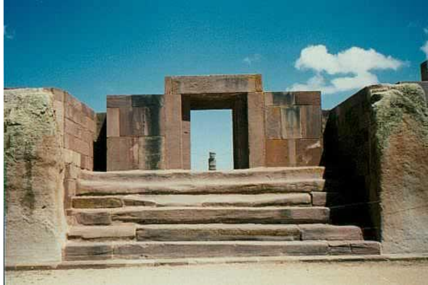
Templo de Kalasaya

La civilización floreciente del Tiahuanaco, así como la encontrada en el Egipto, México, etc., data de miles e incluso de millones de años. En este caso, las actuales ruinas del Tiahuanaco corresponden a eso que fue la ATLANTIDA.