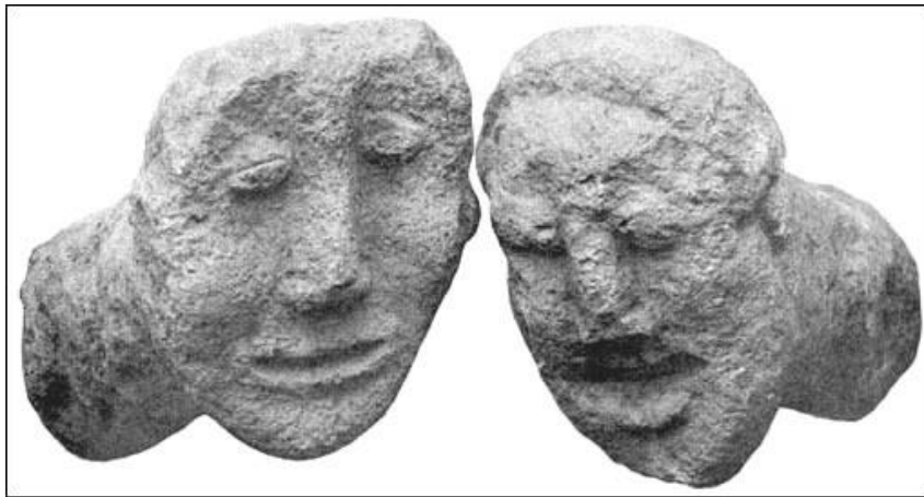
Detalle de las cabezas

Las paredes interiores de este templo se hallan sosteniendo a unas cabezas de todo tipo, la forma de cada cabeza varía y aquí se encuentra el significado de la MUERTE MÍSTICA. En efecto, cada cabeza es un YO, decapitado por la DIVINA MADRE KUNDALINI y son cientos o miles los yoes que caen decapitados bajo la espada ígnea. Este proceso de la muerte mística lo realiza en su primera fase, el BUDHATA junto a la guía de sus Benditos Padres y la disolución o ANIQUILACION del yo, lo realiza la Divina Madre.