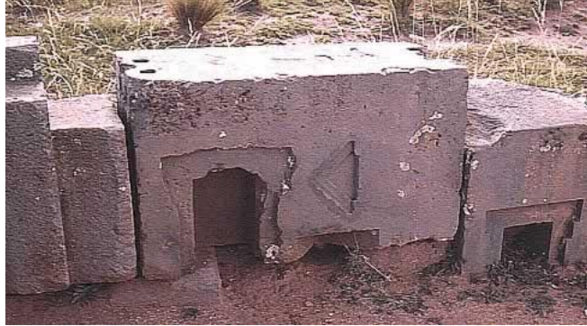
Detalle de las ruinas de Tihuanacu

Tiahuanaco se levantó en la Lemuria también así, hace unos 18 millones de años.