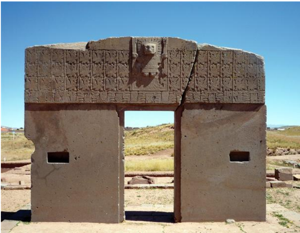
Puerta del Sol

La puerta que conduce a Dios es el sexo, por el sexo se va hacia el Sol, hacia el SOL INTERIOR.